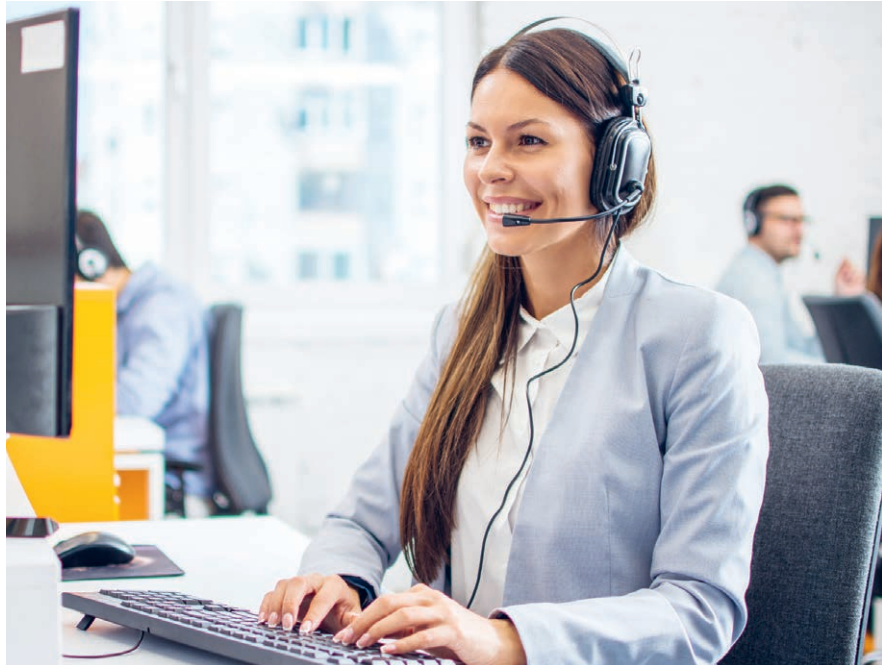
Kundenservice am Telefon lässt sich mithilfe von KI effizienter gestalten.

Durch den Einsatz von KI kann ein Unternehmen von Wettbewerbsvorteilen profitieren. Arbeitsabläufe können durch die Automatisierung von Routineaufgaben optimiert werden, z.B. bei der Dokumentenverwaltung, E-Mail-Verarbeitung oder Meeting-Koordination. KI kann grosse Datenmengen in kurzer Zeit analysieren und Muster erkennen. Daraus abgeleitete Geschäftsstrategien sind präziser und effizienter als menschlich entwickelte. Der Einsatz